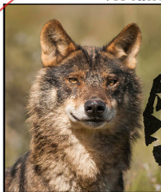
LOBO IBÉRICO ( Canis lupus signatus )