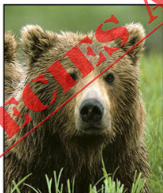
OSO PARDO ( Ursus arctos )