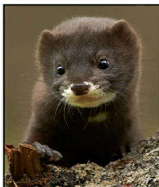
VISÓN EUROPEO ( Mustela lutreola )