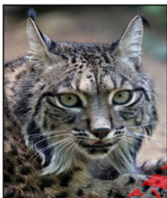
LINCE IBÉRICO ( Lynx pardinus )